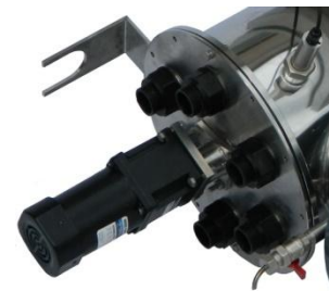
Редуктор механической системы очистки кварцевых чехлов CAO

В CAO применяются двусторонние стеклоочистители, благодаря которым устраняется риск образования органических и неорганических отложений на защитных кварцевых трубках. Сами очистители, которые изготовлены из фторопласта, устойчивы к ультрафиолетовому излучению высокой интенсивности. Расчетный срок службы фторопластовых скребков 24 мес.